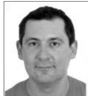
Του Παναγιώτη Βασματζίδη

Όταν η Μάγδα μου μίλησε για αυτό το αρθράκι στην αγαπημένη μας εφημερίδα του Gestalt Foundation, αμέσως το μυαλό μου έτρεξε στην επιθυμία να μοιραστώ τη μοναδική (και κατά κυριολεξία) εμπειρία μου σύγκρουσης σε Επιχείρηση, όπου καλέστηκα να προσφέρω συμβουλευτική και μάλιστα μου ζητήθηκε να χρησιμοποιήσω τεχνικές Gestalt. Αναλογιζόμενος λοιπόν τι ιδιαίτερο έκανα, και αν όντως έκανα κάτι συνοπτικά θα σας παρουσιάσω τα στάδια από τα οποία πέρασα στις εφαρμογές μου.