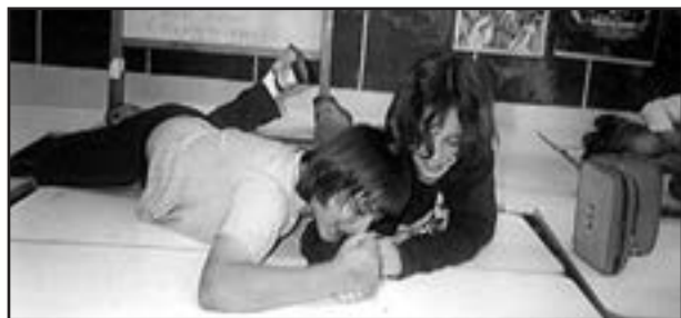
Δύο μαθητές της Τρίτης Τάξης ενώ συνεργάζονται για να ζωγραφίσουν με το ένα χέρι.

Τη σχολική χρονιά 2006 - 2007, στο Β' Πειραματικό