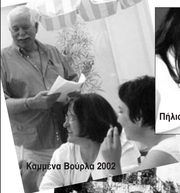
Καμμένα Βούρλα 2002